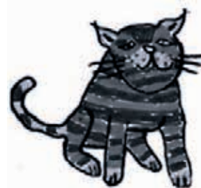
Kirkkonummen Seudun Mielensterveysyhdistys Kisu ry

Käyntiosoite Eerikintörmä 2, 02400 Kirkkonummi https://www.kisukirkkonummi.fi/ Puh. 046 939 5190