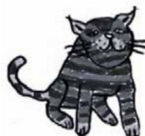
Kirkkonummen Seudun Mielensterveysyhdistys Kisu ry

KIMI on auki ma, ke-to klo 10-14 ja pe 10-13 Käyntiosoite Eerikintörmä 2, 02400 Kirkkonummi https://www.kisukirkkonummi.fi/ Puh. 046 939 5190